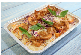
香草大蝦木瓜沙律 (2磅)