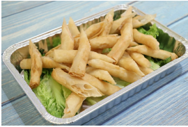
越式炸春卷 (24 細件)